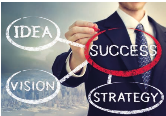
LES STRATÉGIES, les données économiques.